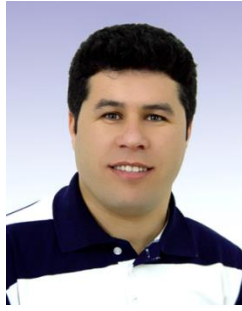
بهشی بهگم : زانیاری کهسی و باگراوندی نهکادیمی